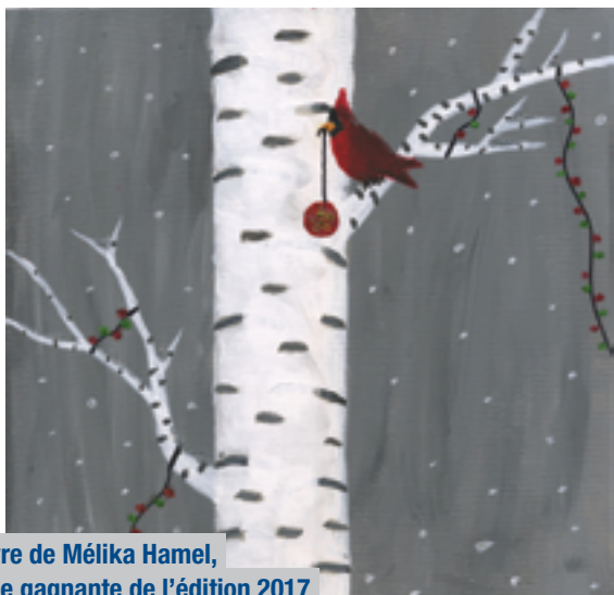
L'œuvre de Mélika Hamel, grande gagnante de l'édition 2017

Tous les détails au www.mrc.jacques-cartier.com . ■