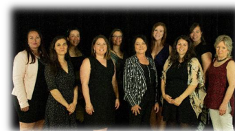
Équipe du CJEL

L'édition 2019 du Gala JeunExcellence Lotbinière a été marquée par la diversité des domaines de ses finalistes, leur passion et leur amour pour Lotbinière. Nous pouvons être fiers de notre jeunesse qui dépasse ses limites, excelle et qui fait rayonner Lotbinière partout au Québec. Vous pouvez consulter notre page Facebook pour connaître tous les finalistes et les gagnants . Merci à tous nos partenaires, dont notre partenaire majeur le Regroupement des Caisses Desjardins de Lotbinière, qui ont rendu possible la tenue de cet évènement. Merci également aux gens présents d'encourager nos jeunes. On se donne rendez-vous pour la 8 e édition en 2021.