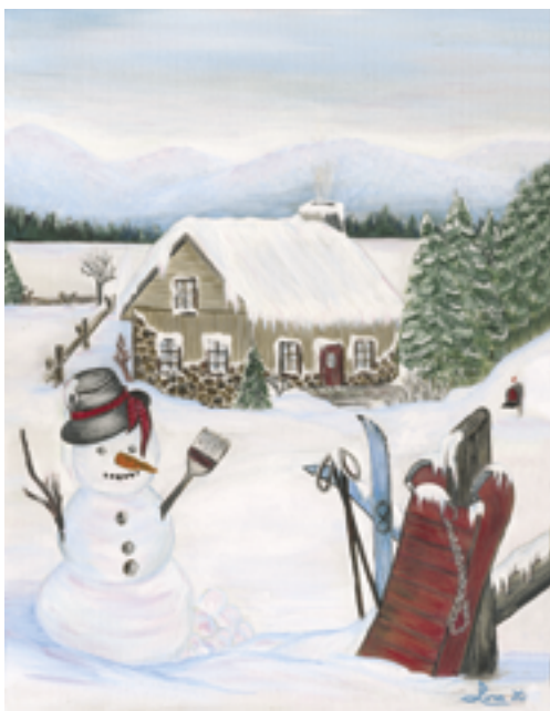
« Un souvenir d'enfance » de Lina Guillemette, grande gagnante de l'édition 2020

Surveillez la page Facebook de la MRC ou le www.mrc.jacques-cartier.com pour tous les détails. ■