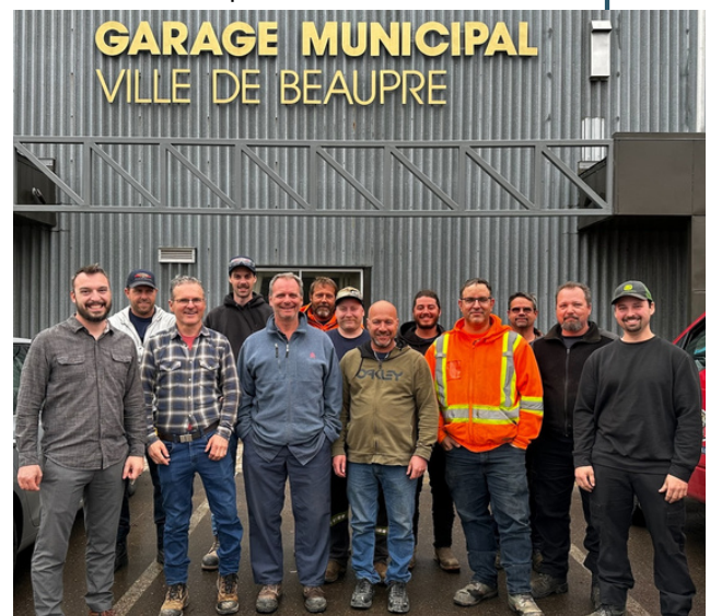
L'équipe des travaux publics de Beaupré

Un énorme merci à tous les membres de l'équipe de travaux publics, votre travail fait une différence majeure dans la qualité de vie des citoyens et citoyennes !