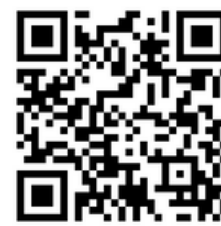
Site de la Ville pour l'infolettre