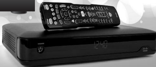
ENREGISTREUR G8 (9865)