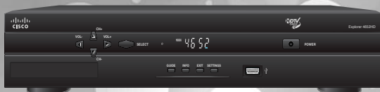
TERMINAL NUMÉRIQUE HD (4642)

60$ de rabais applicable sur l'un ou l'autre de nos terminaux