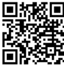
Page Facebook Ville de Beaurpré