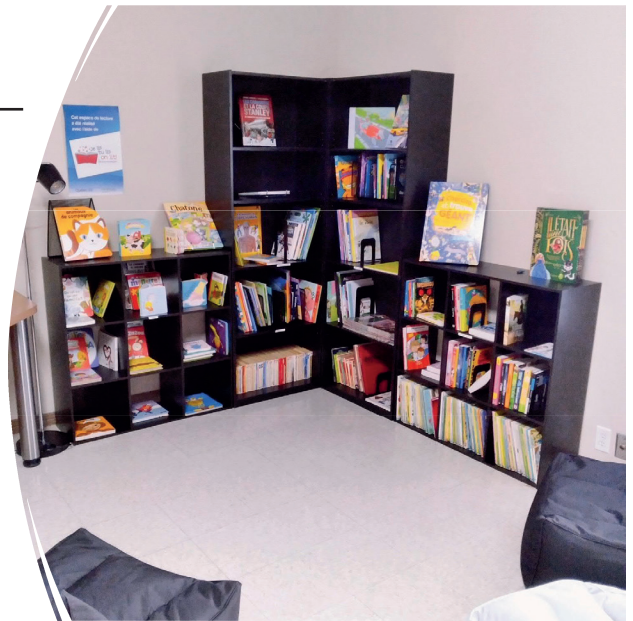
Nous vous remercions de votre participation au sondage de la bibliothèque de Saint-Martin/Saint-René. (parution février 2022)